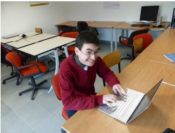
Quand le père supérieur travaille, les souris dansent

Je choisis la Liturgie des Heures, entre autres... Elle a fondamentalement participé à la configuration et à l'unité de mon être au Christ. Goutte à goutte, elle fait de moi un porteur du Christ, un Christophore. Et cela me remplit de joie et me fait avancer dans l'Amour.