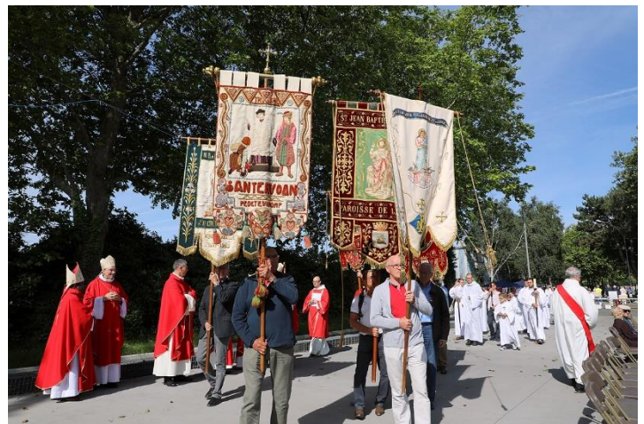
Clôture du Synode diocésain à Saint-Brieuc