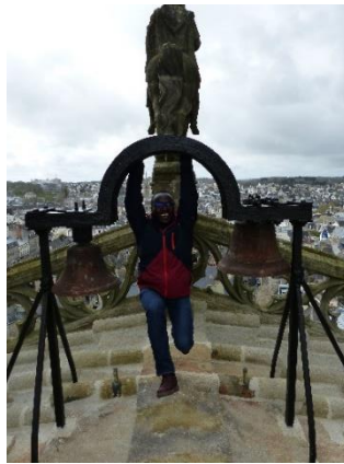
Visite de la cathédrale de Quimper