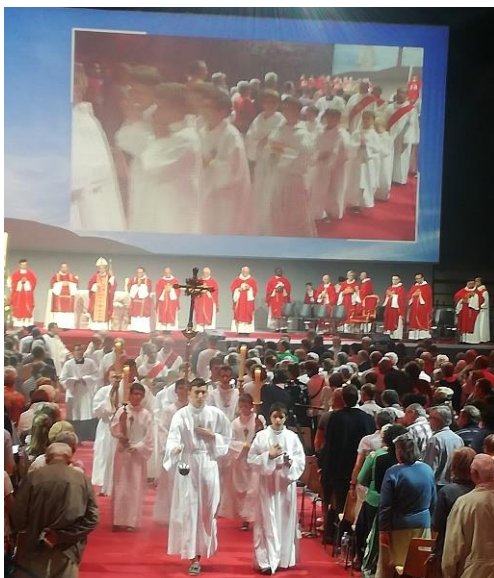
Rassemblement pour les 700 ans du diocèse de Luçon