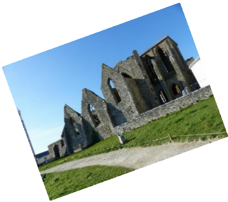
Excursion à la pointe Saint Matthieu