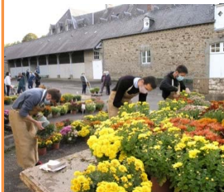
Vente chez les sœurs au profit d'une maison au Pérou