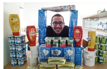
Un intendant comblé