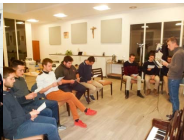
Répétition de chants du mardi soir