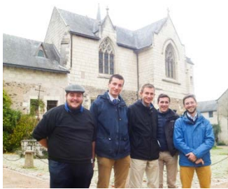
Au sanctuaire de Béhuard

Les exemples concrets de vie fraternelle et de charité chrétienne (missions d'évangélisation, colocations étudiantes, groupes de catéchumènes) ont été pour moi de véritables sources d'inspiration. Rencontrer des prêtres du diocèse, des jeunes et plus globalement des chrétiens engagés dans la vie paroissiale, m'a permis de voir la pluralité des initiatives proposées pour amener les gens au Christ et à se construire dans la foi. Un moment fort allant dans ce sens reste l'après-midi à la maison Lazare d'Angers, une colocation entre sans-abris et jeunes. J'ai été marqué par les discussions que nous avons eues avec les colocs après la visite des lieux.