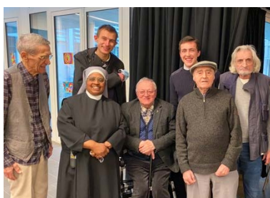
Visite à Ma Maison de Rennes

Le mercredi nous quittons Saint-Pern pour un service caritatif. Nous allons visiter des personnes en situation de fragilité, de pauvreté. Ces temps de rencontre nous ouvrent à la compassion et à l'amour de l'autre tel qu'il est, en nous rappelant qu'il y a le Christ souffrant derrière chaque visage.