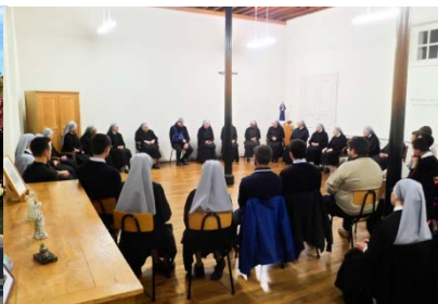
Présentation de notre promotion aux Petites Sœurs de Saint-Pern