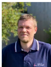
Vincent Leblond (34 ans) Diocèse de Rennes Ministre du Sport et des Transports