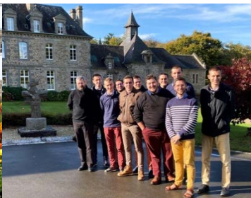
Messe de la Toussaint chez les dominicaines de Beaufort